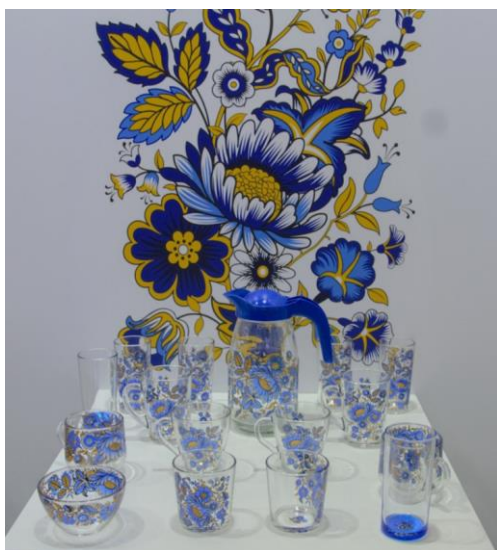
(ДЕКОСТЕК ГУСЬ-ХРУСТАЛЬНЫЙ ЗАВОД ДЕКОРАТИВНЫХ СТЕКЛОИЗДЕЛИЙ)